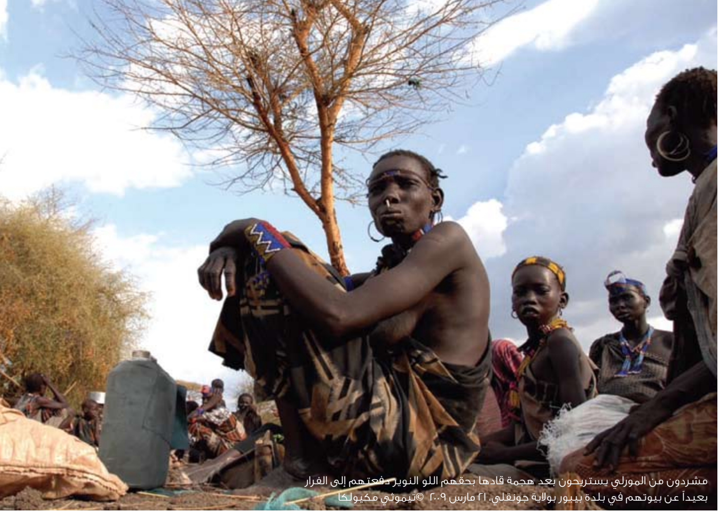
مشردون من المورلي يستريحون بعد هجمة قادها بحقهم اللو النوير دفعتهم إلى الفرار بعيداً عن بيوتهم في بلدة بيبور بولاية جونقلي، ٢١ مارس ٢٠٠٩

لحالة انعدام الأمن، طفيفاً جداً على ديناميات الأمن الداخلي داخل جنوب السودان. ووقعت امثلة ارتكبت فيها الإساءة تحت ظل رعاية نزع سلاح المدنيين، بيد أن المسعى لم يقود إلى عنف بمستوى ما وقع في سنتي ٢٠٠٥-٢٠٠٦. وبالفعل كان التنفيذ هادئاً نسبياً، وإن رجع هذا إلى حد كبير لما اتسم به التنفيذ من حذر وعشوائية، وليس نتيجة لتغيير أساسي في الاستراتيجية من جانب حكومة جنوب السودان. وتدل جميع المؤشرات على التزام الحكومة مواصلة نزع سلاح المدنيين في سنة ٢٠٠٩، بالقوة إذا لزم الأمر. ٨٢