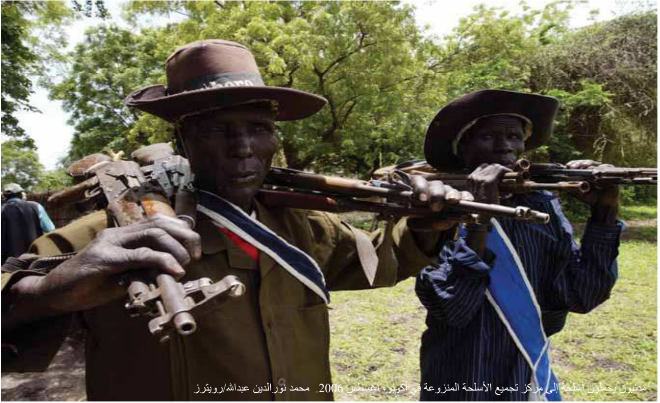
مجنونون بحملون أسلحة إلى مركز تجميع الأسلحة المنزوعة في أكوبو، أغسطس 2006.